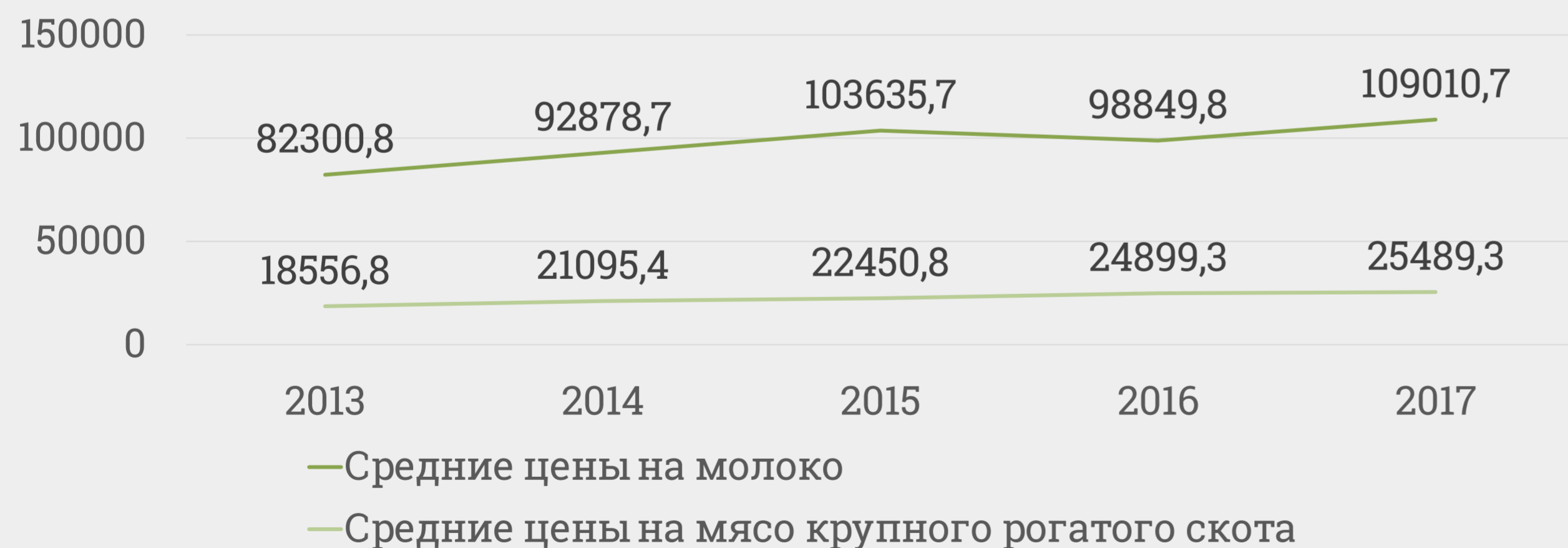
Динамика средних цен производителей на молоко и мясо крупного рогатого скота в Архангельской области руб./т на конец периода

За последние годы существенно выросла стоимость молока, произведенного на территории региона. В период с 2013 по 2017 рост составил 32,5%. Цены производителей на мясо за аналогичный период выросли на 37,3%.